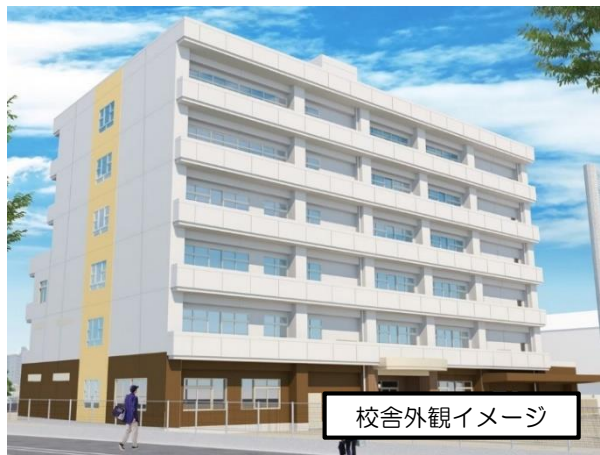
校舎外観イメージ